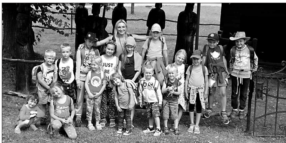
Příměstský tábor – 2. běh