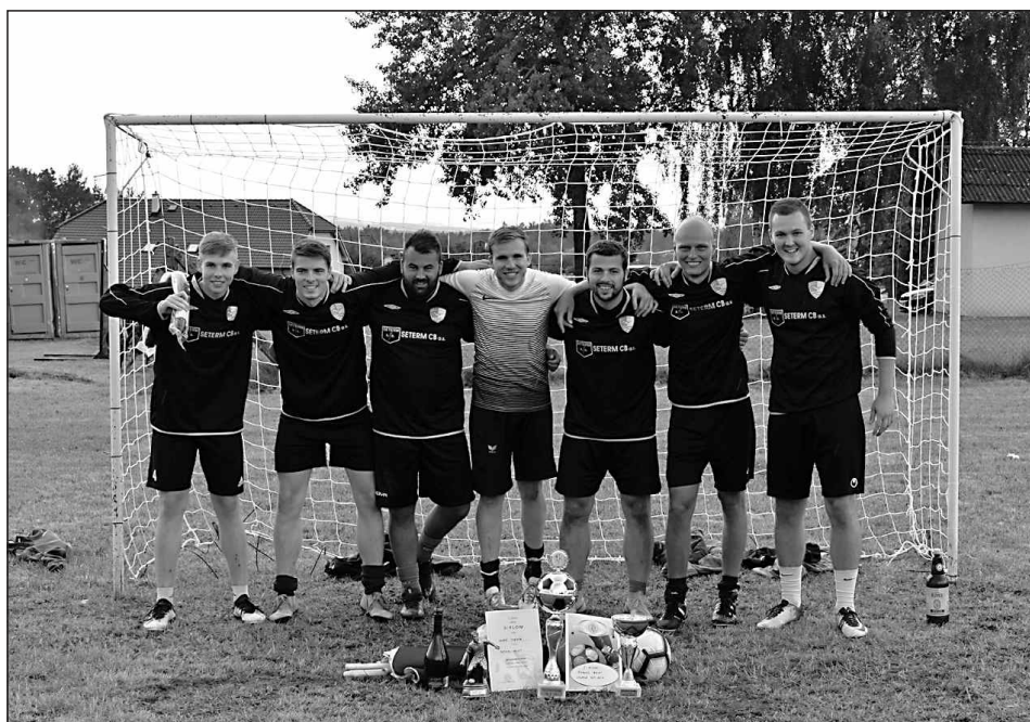
Vítězný tým 20. ročníku turnaje v malé kopané „O pohár starostky obce“ – Černej balet