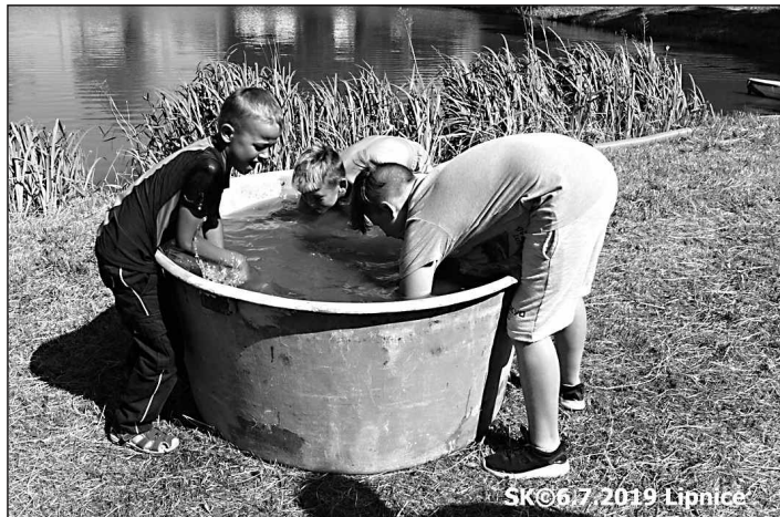
SKČ67, 2019 - Lipnice