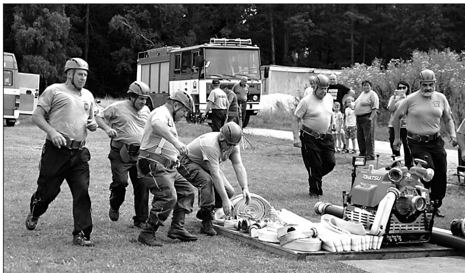
„O pohár starostky obce Jílovic“ družstvo SDH Šalmanovice – muži nad 50 let

Za letošní hasičskou sezónou, co se týče soutěží, můžeme pomalu zavřít vrátka na petlici. Letošní sezóna byla opravdu skvělá. Mezi družstva se pomalu zase dostal nový svěží vánek, který pořádně nabral na obrátkách. Je fajn pozorovat kolem sebe mírnou nervozitu, bojovnost, snahu, nadšení, radost, sdílení, odvalu, srandu, oporu, zážitky a všechny ty emoce života.