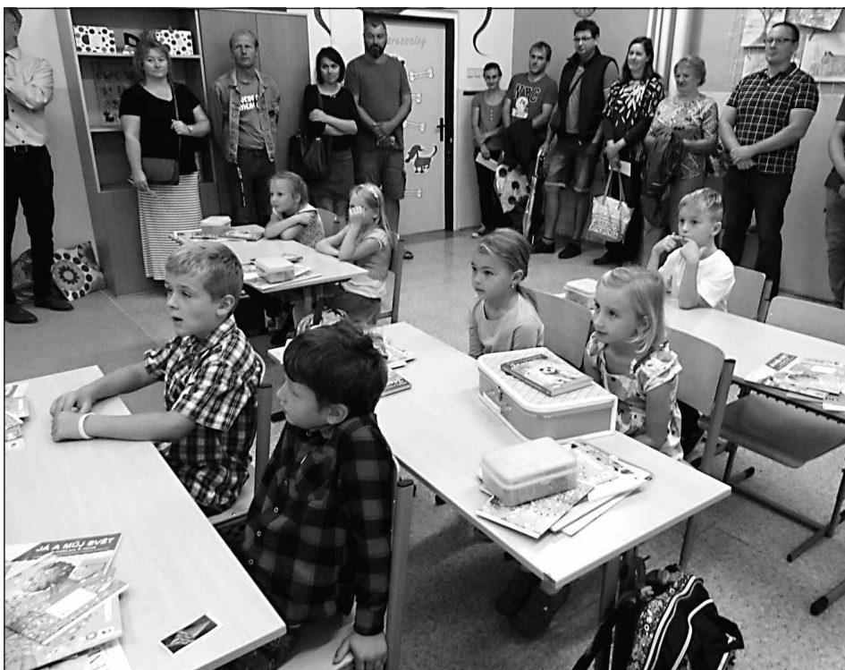
Záhájení v 1. třídě