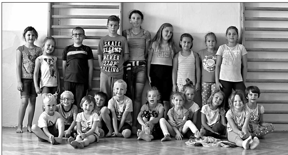
Příměstský tábor – 1. běh