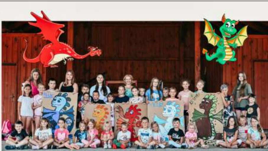
Příměstský tábor Jílovice 2023